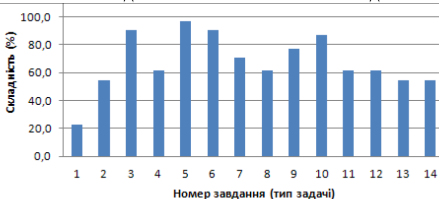
Рис. 2. Діаграма складності.

Як видно, найскладнішим виявилось завдання 1 на дії з дробовими числами, звичайними дробами. Викликає певну тривогу невиконання деякими учасниками завдань 9–11 (робота з масштабами). Попередній нестрогой аналіз показує, що причина в корельованості цих завдань із завданням 1 та 2 (робота з десятковими дробами). Легко побачити, що понад 30 % вчителів не володіють базовою статистичною та геометричною грамотністю, понад 40 % не вміють орієнтуватись в простих задачах з прямокутними декартовими координатами та обчислювати довжини дуг.