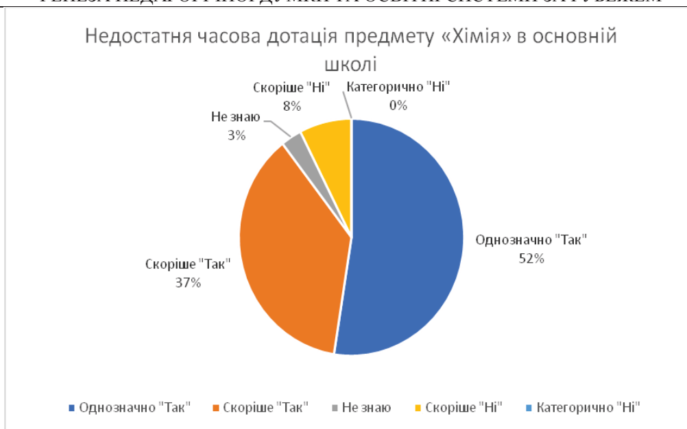
Рис. 2. Відповіді вчителів хімії щодо причини 2: Недостатня часова дотація предмету «Хімія» в основній школі.

Причина 3: Важкий зміст державної програми «Хімія» в основній школі.