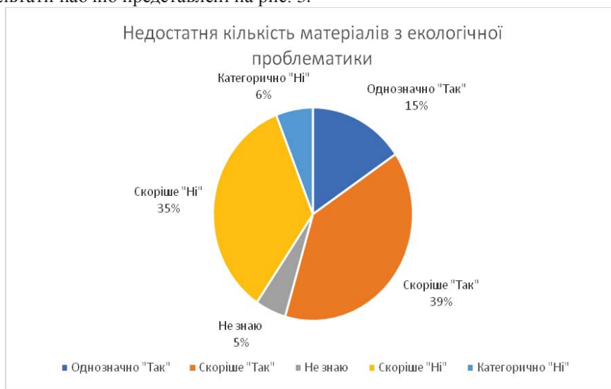
Рис. 3. Відповіді вчителів хімії щодо причини 5: Недостатня кількість матеріалів з екологічної проблематики.

Результати наочно представлені на рис. 3.