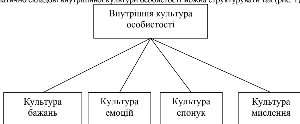
Рис. 1. Складові внутрішньої культури особистості.

Схематично складові внутрішньої культури особистості можна структурувати так (рис. 1).